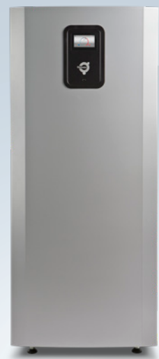
Mega L en Mega XL

A+++ Energieklasse wanneer de warmtepomp onderdeel is van een geïntegreerd systeem. A+++ Energieklasse wanneer de warmtepomp de enige warmteopwekker is. Energieklasse overeenkomstig Eco-design richtlijn 811/2013.