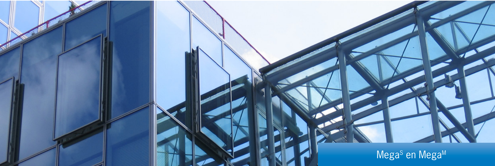
Mega S en Mega M